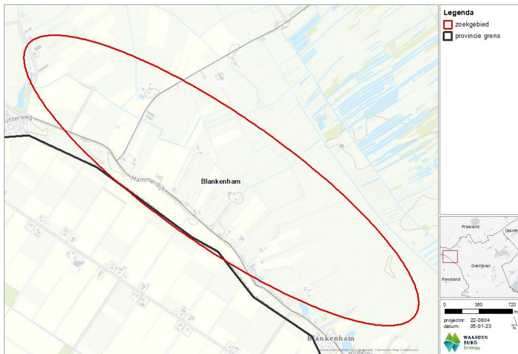
Figuur 2.1 Zoekgebied Blankenham, gemeente Steenwijkerland.

Het voornemen is om de mogelijkheden voor het realiseren van windturbines in het zoekgebied Blankenham in beeld te brengen. Er zijn nog geen concrete plannen betreffende lay-out en windturbintypes. Het zoekgebied is gelegen in het uiterste noordwesten van de provincie Overijssel, nabij het dijkdorp Blankenham (zie Figuur 2.1). Het zoekgebied grenst aan de provincie Flevoland en ligt nabij de provinciegrens tussen Overijssel en Friesland. Het zoekgebied kenmerkt zich door de vele intensieve agrarische graslanden en her en der boerderijen. Direct grenzend aan het zoekgebied, aan de oostkant, is het Natura 2000-gebied Weerribben gelegen.