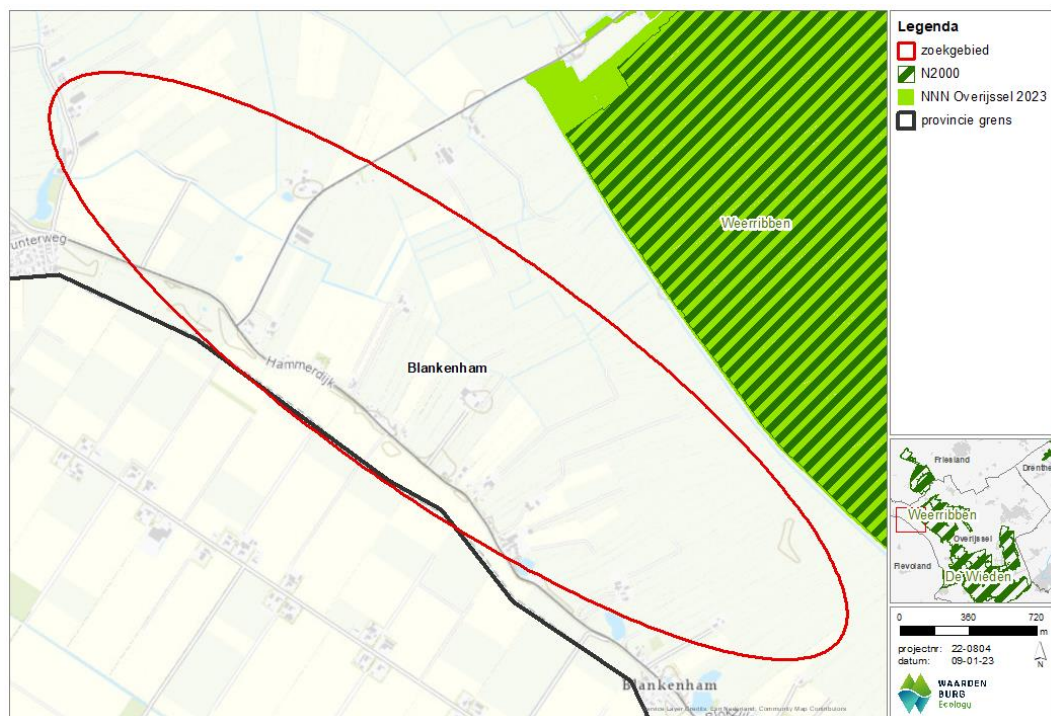
Figuur 5.1 Ligging van het NNN ten opzichte van het zoekgebied; het Natura 2000-gebied Weerribben is groen gearceerd.

Binnen het zoekgebied zijn geen delen van het Natuurnetwerk Nederland (NNN) gelegen. Het Natura 2000-gebied Weerribben is eveneens onderdeel van het NNN en ligt op enkele honderden meters ten noordoosten van het zoekgebied (zie Figuur 5.1). Het NNN kent geen externe werking in de provincie Overijssel. De mogelijke windturbines worden buiten het NNN gerealiseerd, er is dus geen sprake van ruimtebeslag en ook niet van overdraai. De bouw en het gebruik van windturbines binnen het zoekgebied leidt niet tot aantasting van wezenlijke kenmerken en waarden van het NNN. Een nadere duiding van de aanwezige beheertype(n) en de effectbepaling hierop kan derhalve achterwege blijven.